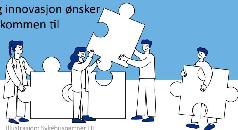
Illustrasjon: Sykehuspartner HF

Forskningsdagene er en festival der forskere over hele landet viser frem forskningen sin til folk flest! Sykehuset Innlandet, i regi av Forskningscenter for aldersrelatert funksjonssvikt og sykdom (AFS), Forskningscenter for eksistensiell helse (FEH), ROPforsk - Forskningscenter for rus- og psykiske lidelser, og avdeling for forskning og innovasjon ønsker ansatte, pasienter og pårørende velkommen til markering i festsalen på Sanderud.